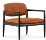
03 YOKO POLTRONE CM 77X75 H73