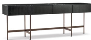
11 KENNETH CONTENITORE LIVING CM 240X55 H90