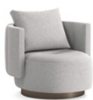
03 TORII BOLD POLTRONE MEDIUM GIREVOLI CM 88X88 H82