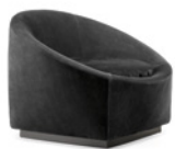
03 CAPRI BASE POLTRONA CM 98X90 H70