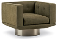
03 SALLY POLTRONE GIREVOLI CM 86X84 H63