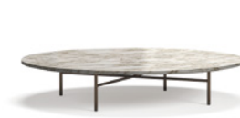
05 LELONG 23 TAVOLINO Ø CM 150 H28