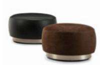
04 TORII BOLD POUF SMALL Ø CM 65 H41