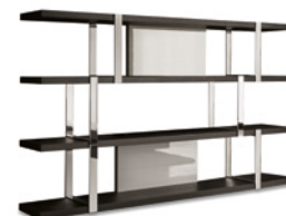
12 DALTON "CHROME" BIBLIOTHÈQUE CM 240X40 H148