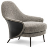
04 ANGIE SESSEL CM 88X94 H87