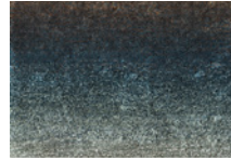
10 DIBBETS "RAINBOW" TEPPICH CM 500X400