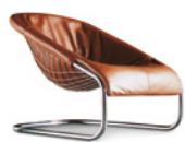
02 CORTINA POLTRONA CM 73X97 H71