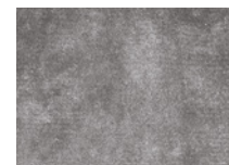
10 DIBBETS TAPPETO CM 400X400