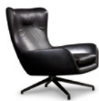
03 JENSEN BERGÈRE GIREVOLE CM 81X97 H94