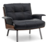
02 DAIKI FAUTEUILS CM 93X91 H69